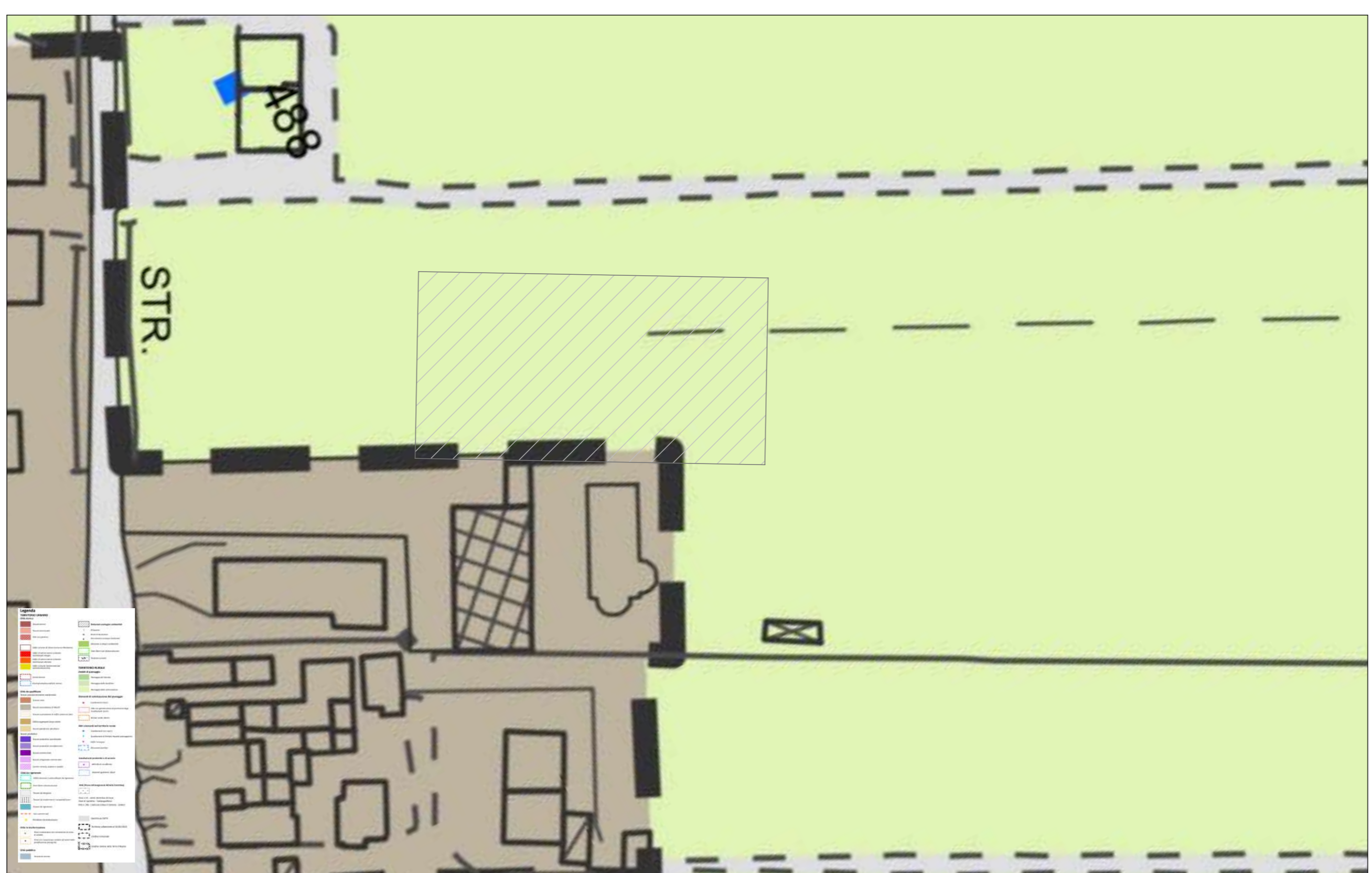
INQUADRAMENTO CARTOGRAFICO - TAVOLA TR1-14 PUG